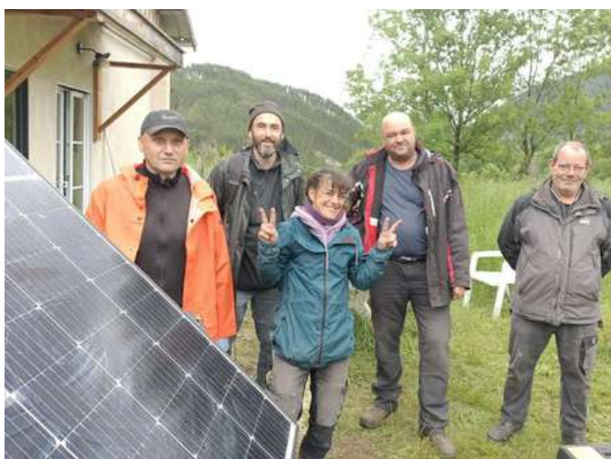
Dernière installation en mai 2025 à Lalley

Depuis maintenant deux ans, les CVT proposent gratuitement à des familles propriétaires en précarité énergétique, l'installation de 4 panneaux en Autoconsommation Individuelle. 8 familles en ont bénéficié.