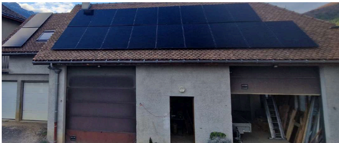
Accompagnement CVT: 9 Kwc posés au services techniques de Roissard

Apporter un accompagnement technique et méthodologique aux collectivités et structures de l'Economie sociale et solidaire pour déployer leur propres centrales solaires